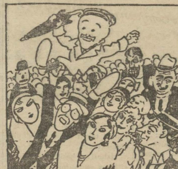
3: Hasan B. — Aman yahu, durun, beni karga tulumba yapıp göklere çıkarmayın!