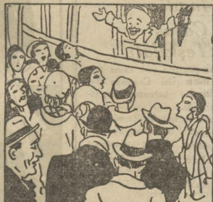
2: Hasan B. — Pazar ola yıldız başılar, pazar ola san'atkar başılar, merhaba, merhaba, merhaba...