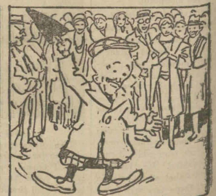
4: Hasan B. — Göge çıkmıya haeset yok burada bukadar yıldız var, kepinizi gölge ararken yerde buldum.