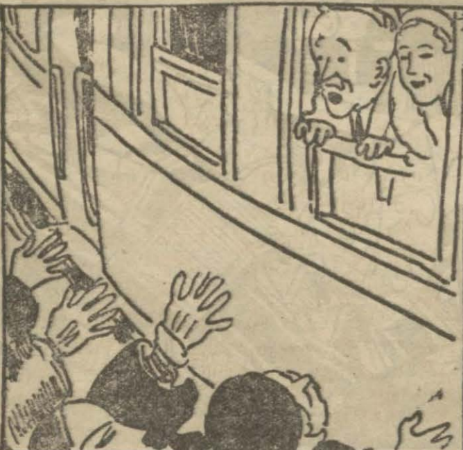
1: Matmazel Nelli — Bak Hasan bey bütün (Holivut) san'atçıları seni istikbale gelmişler.