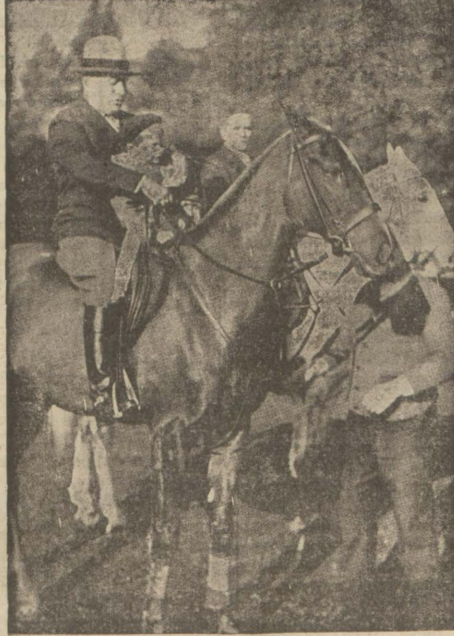
İtalya Başvekili küçük Müsolini ile at gezintisi yapıyor

Silâhların tahdidi için muhtelif teklifler yapıldı. Biz İtalyanlar, her hal şekline taraftarız. Biz silâhların tah-